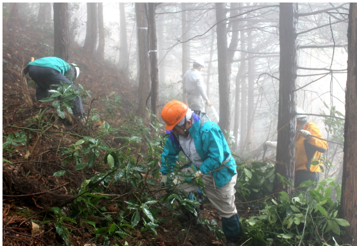
「高尾の森づくりの会」 作業の様子

間伐する木に印を付けたたり、安全に作業ができるように枝を落とすなど。作業道を作っている方について聞いたところ『私は山歩きが好