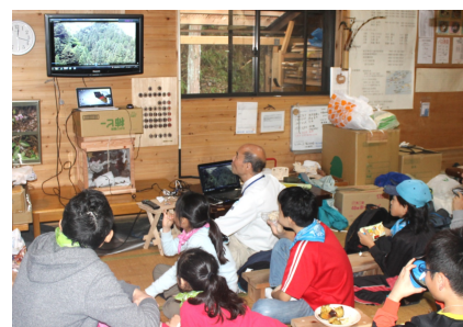
取材日に行われていた親子森林体験スクールの様子

きで、日本中の山に登りました。今は、山を征服するより、森を作ることへの達成感の方が楽しいです」との事。かつこいいですね。 同会の主な活動は、 ①日本山岳会会員と一般会員のボランティア活動により、森林の整備、自然保護意識の啓発。 ②会員相互の交流を図ることを目的とする活動。 その他、作業道の整備、森林活動の技術向上研修など。 動植物などの調査も 木下沢林道沿いにある高尾の森作業小屋を拠点に、178畝という広大な国有林が活動フィールドです。会員は約200人。女性は3割。作業日には約100人の方が集まり、A、Dの作業班に分かれて作業します。この様な基本の作業以外に、ものづくり、動物・植物の調査、道具班などの専門班があります。また、