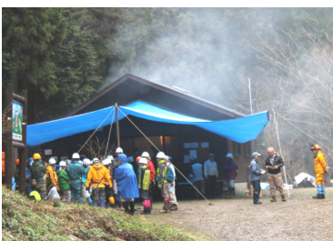
作業小屋で出発前の打ち合わせ 木下沢。この橋も会員で作りました