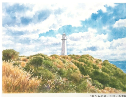
「海からの風」 下田・爪木画

ギャラリー 桜草 八王子市兵衛1-24-6 (八王子みなみ野駅東口徒歩3分) 042-637-2530